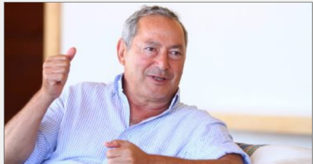
المهندس سميح أنسى ساويرس